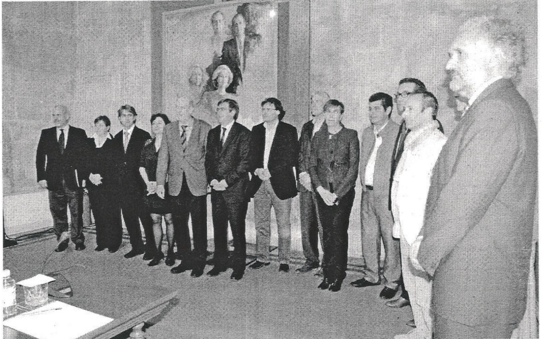
EUROBIJOUX. El acuerdo entre los bisutereros europeos se logró en la feria de Palma. En la imagen, los fabricantes en el Consolat de Mar

MiBi es la nueva marca registrada por la asociación de fabricantes italianos Club Bi y promocionada por EuroFashion Bijoux,