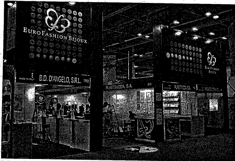
Un 'stand' de bisutería menorquina en la feria de Hong Kong, bajo la marca Eurofashion Bijoux. /EL MUNDO

Eurofashion Bijoux lucirá como una marca europea de calidad y diseño en diferentes ciudades chi-