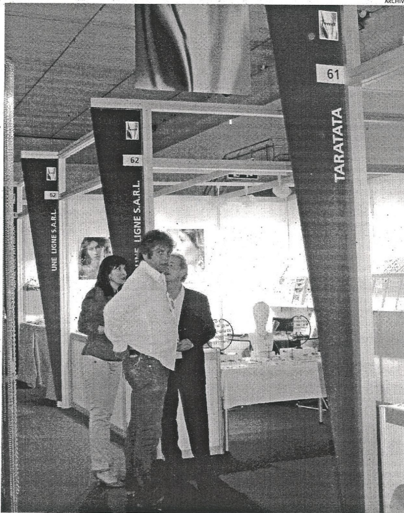
RECINTO FERIAL. El año pasado fue el primer certamen celebrado en la ciudad palmesana

Gracias a la implicación del MIBI FABBRICHE ITALIANE, Asociación Italiana de Fabricantes de Bisutería, en el calendario unificado que impulsa junto con SEBIME, los expositores italianos han incrementado notablemente su presencia en la feria respecto al año pasado, un aspecto que también se ve reflejado en la participación de los bisuterios alemanes, griegos, checos y